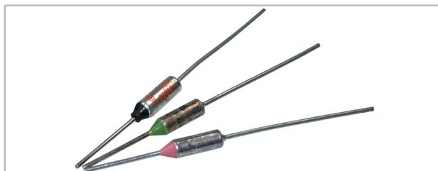
Temperatursicherungen / Thermal fuses

Several types, available from stock 70° - 240°C Standard quantity: 200 pcs per unit