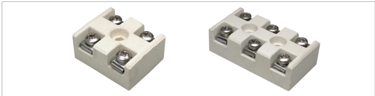
2-pole, 42 x 33 x 20 mm

Multi-pole terminal blocks, contacts stainless steel Working temperature: max. 450°C current-carrying capacity 20 A